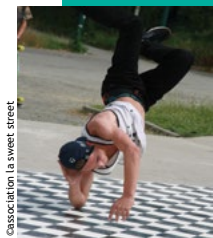
association la sweet street

Service enfance jeunesse et sport 02 96 49 02 49